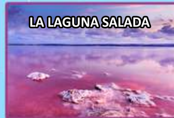
LA LAGUNA SALADA