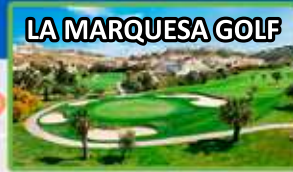
LA MARQUESA GOLF