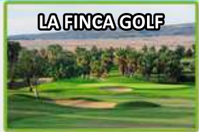
LA FINCA GOLF