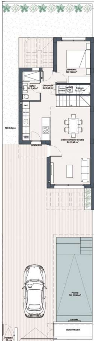
PLANTA BAJA GROUND FLOOR