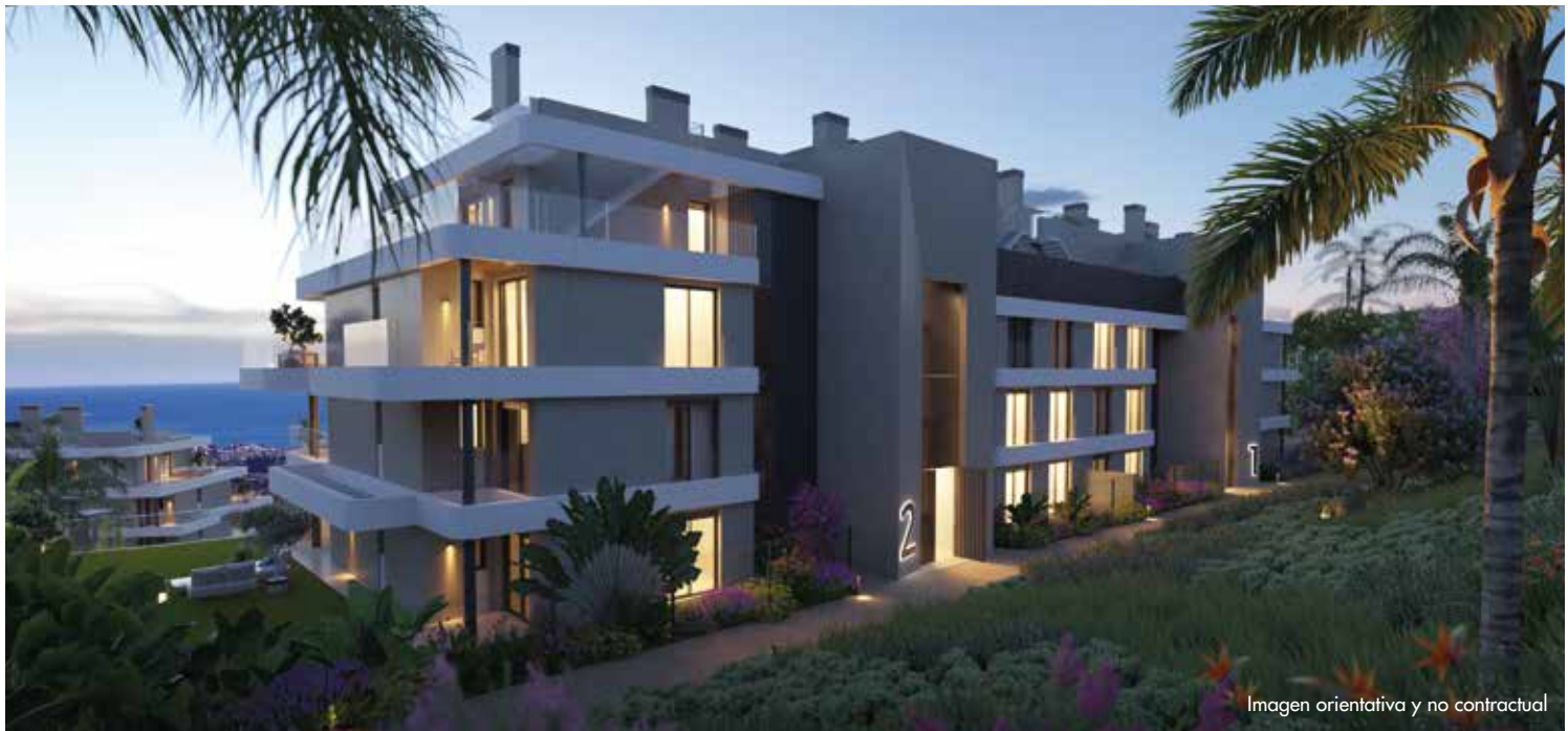
Imagen orientativa y no contractual

Calanova Collection , en Mijas, se encuentra en una ubicación estratégica que combina a la perfección un horizonte de mar y montaña.