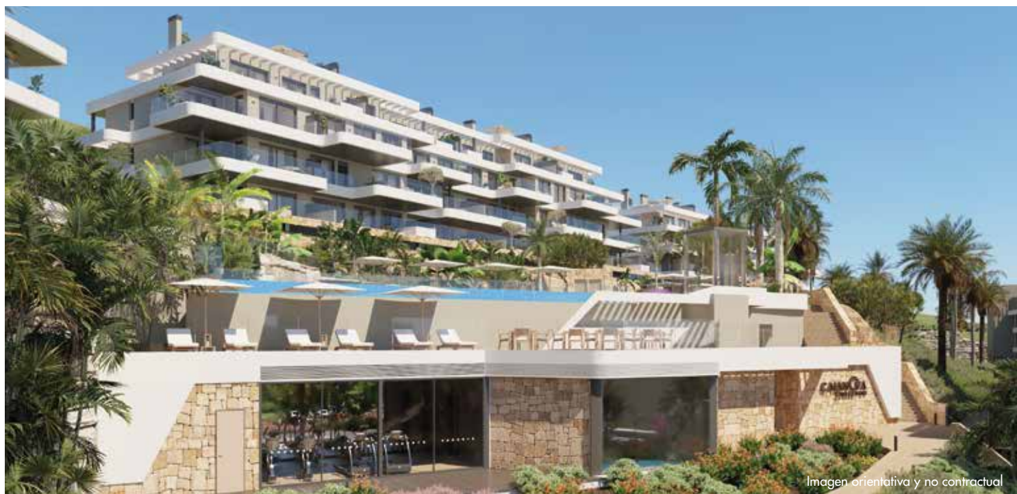
Imagen orientativa y no contractual