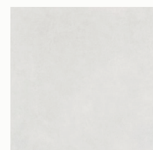
Model White 120x120 cm.

En los baños el pavimento será de gran formato y colocado de suelo a techo continuo. Gres porcelánico rectificado marca PORCELANOSA o similar.